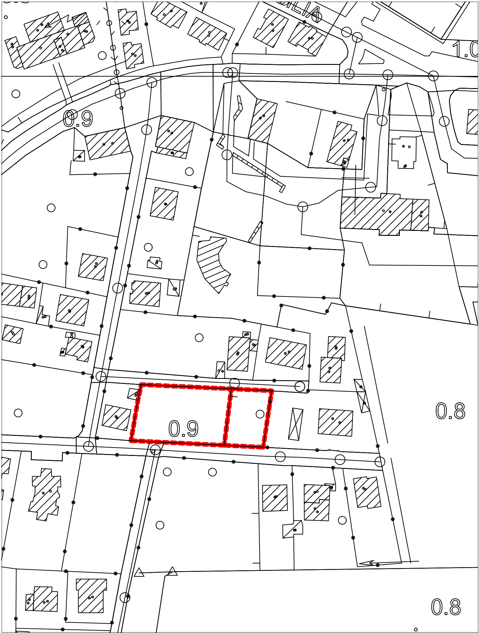
ESTRATTO C.T.R. 1:1000