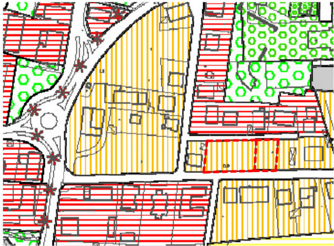
ESTRATTO PI_tav2.3 (da 1:5000)