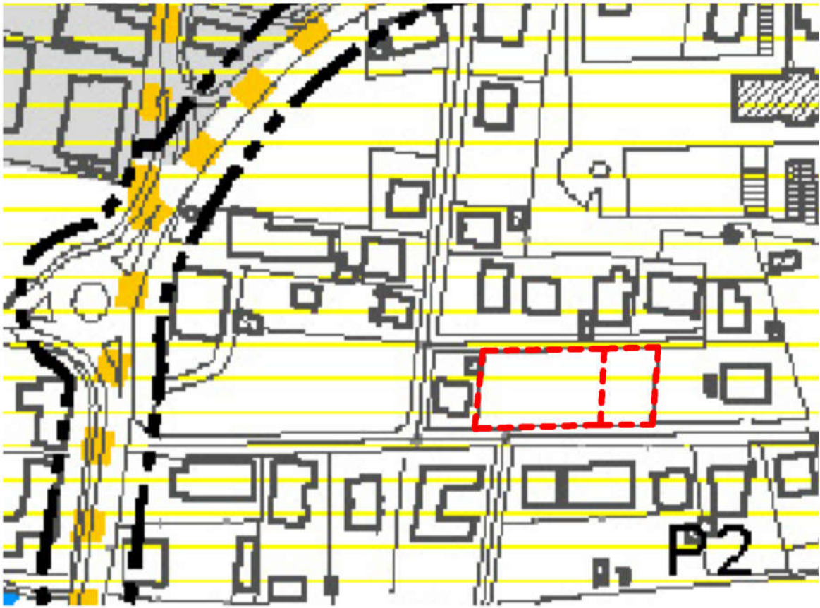
ESTRATTO PAT b01